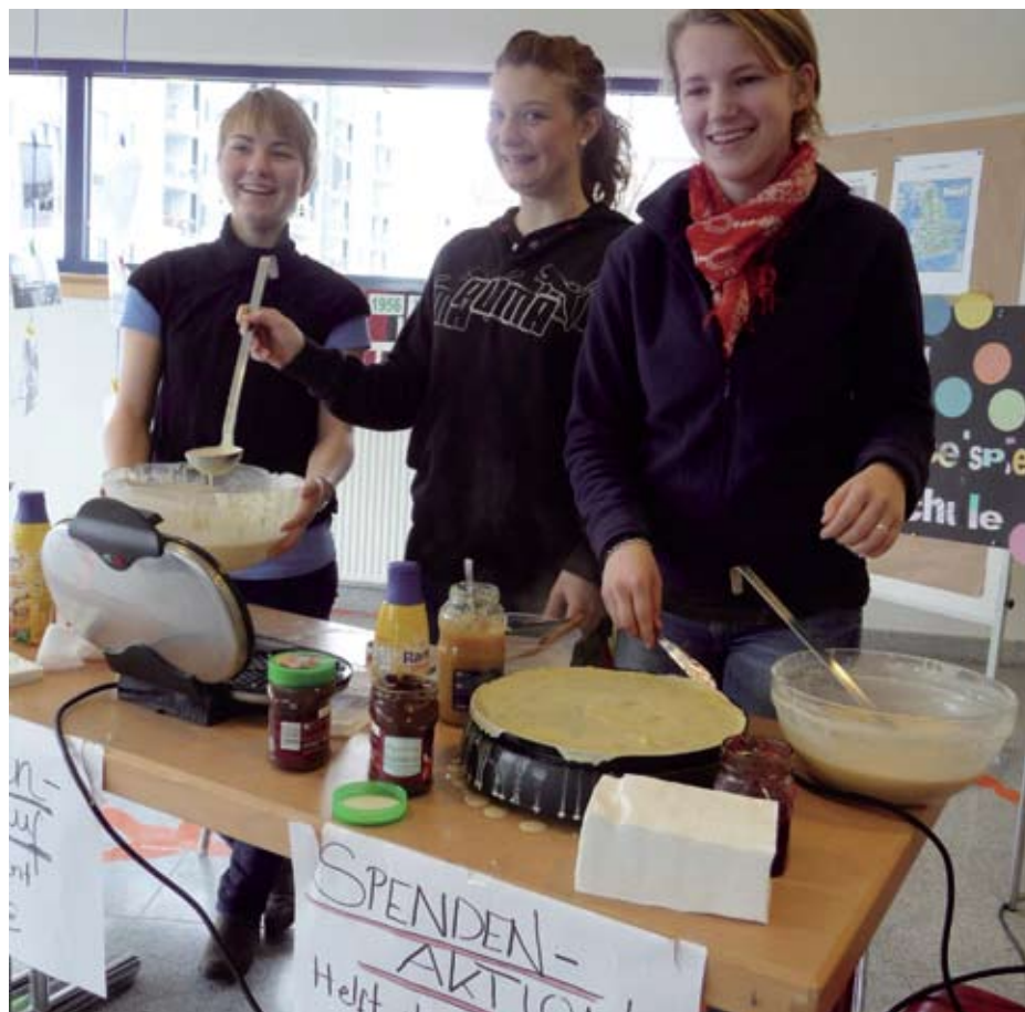
Mit einem Kuchenverkauf sammelten SG-Schüler/-innen Spenden für die Erdbebenopfer. Das KBW verdoppelte die Summe.