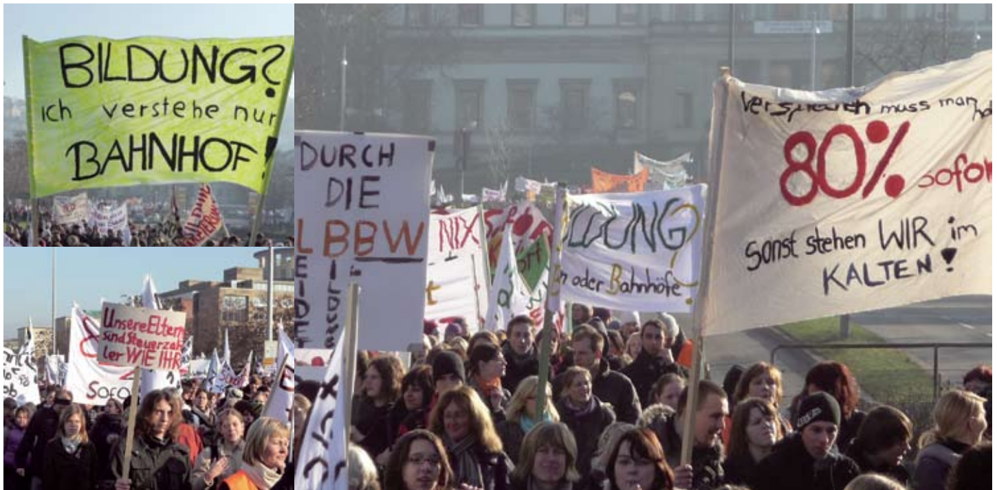
Mit Trillerpfeifen und zahlreichen Transparenten zogen 20.000 Schüler, Lehrer und Eltern vom Hauptbahnhof zum Schlossplatz. Parallel dazu liefen im Landtag die Haushaltsberatungen.

Stuttgart | Mit einer Großdemonstration haben Schüler und Lehrer am 19. Januar 2010 für eine bessere Förderung der Privatschulen protestiert. Die etwa 20.000 Demonstranten forderten von der Regierung, die Finanzhilfen wie versprochen aufzustocken.