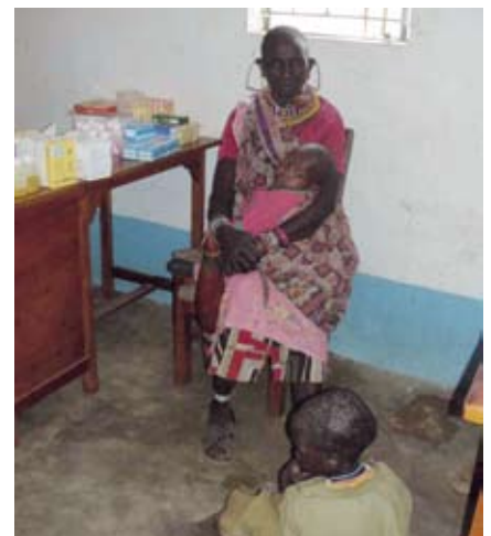
Mobilklinik in einem Klassenzimmer in Ngaresurgoi

Zahnklinik bereitzustellen. Diese hoffen wir Ende des Jahres eröffnen zu können. Durch die sehr hohe Anzahl an Patienten ist es uns möglich trotz niedriger Gebühren die laufenden Kosten der Gesundheitsstation aus eigenen Mitteln zu finanzieren. Interessant zu beobachten finde ich, dass der Hauptteil der Patientinnen Musliminnen sind, ein schönes Zeichen für interreligiösen Dialog und Zusammenarbeit. Wir hatten begonnen, in drei Dörfern regelmäßig mit einer Mobilklinik zu gehen. Das ist mittlerweile „Standard“ an jedem letzten Freitag im Monat.