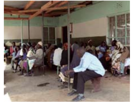
Wartebereich der Gesundheitsstation Isiolo

Durch eine günstigere und klarer strukturierte Gebührenordnung sehen die mittlerweile zwei Krankenschwestern nun täglich um die 200 Patienten, vor allem Mütter mit kleinen Kindern. (Unter fünf Jahren sind Behandlung und Medikamente kostenlos). Des weiteren war es notwendig eine zweite Laborassistentin anzustellen, um mit den ca. 500 Malariatests im Monat fertig zu werden. Notwendige Umbaumaßnahmen haben wir in den letzten Monat begonnen, z.B. wurde die Wartezone deutlich vergrößert und überdacht. Zwei neue Toiletten wurden gebaut, und momentan werden drei Räume renoviert und in ein ehemaliges Lager Fenster eingebaut um daraus eine Apotheke und Rezeption zu machen. Ein großer Wassertank ersetzt den kleinen, um genügend sauberes Wasser für eine