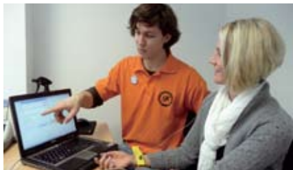
Stressbelastung wird mit dem CardioScan gemessen.

Stuttgart | Betriebliches Gesundheitsmanagement die Zweite: Neben dem Programm der Techniker-Krankenkasse können bietet das Kolping-Bildungswerk Württemberg e. V. in Kooperation mit dem Fitness-Club Fellbach seinen Mitarbeiter/-innen am Standort Stuttgart einen Fitnessführerschein an.