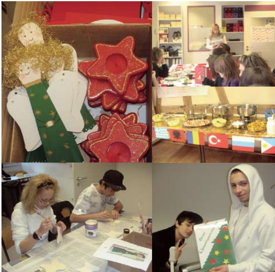
Die BvB-Teilnehmer stellten für ihren Weihnachtsbrunch alles selbst her – von der Deko bis zum internationalen Büffet.

Am Ende des Tages erhielt jede/r eine Urkunde für die gute Mitarbeit. Das Ergebnis des Projekts begeisterte alle. Die Klasse freute sich über einen erfolgreichen und