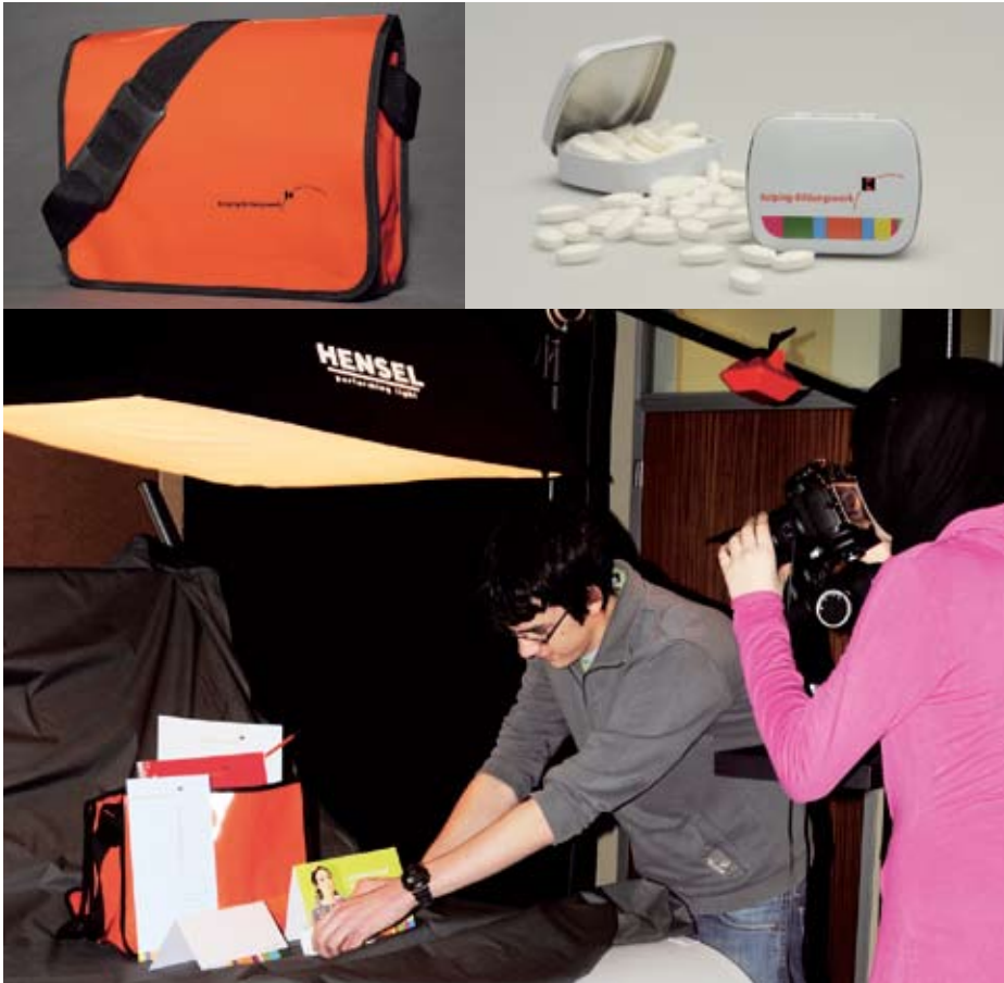
Linke Seite: Verschiedene Lichtformer erzeugen je nach Position den richtigen Schattenwurf oder verhindern ihn. Aufgehellt wird mit Styroporplatten. Oben: Die Objekte werden vor der Hohlkehle des Aufnahmetisches dekorativ arrangiert.