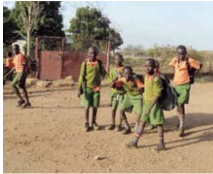
Einige der 1500 Schüler auf dem Compound in Isiolo

Es gibt Regionen in denen im Mai/Juni 2008 der letzte Regen fiel. Für die Bevölkerung ist der Wassermangel eine Katastrophe: 6,5 Millionen Menschen in Kenia sind bereits abhängig von Lebensmittel- und Wasserlieferungen, Zehntausende Stück Vieh sind verdurstet und verhungert, viele Menschen, vor allem kleine Kinder, sind unterernährt. Eine karge Mahlzeit am Tag ist für die Nomaden im Distrikt Isiolo, wie auch in